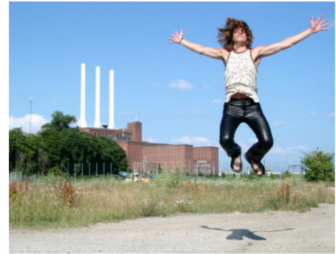
1: Paradigmeskift Nye samværsformer / kulturer